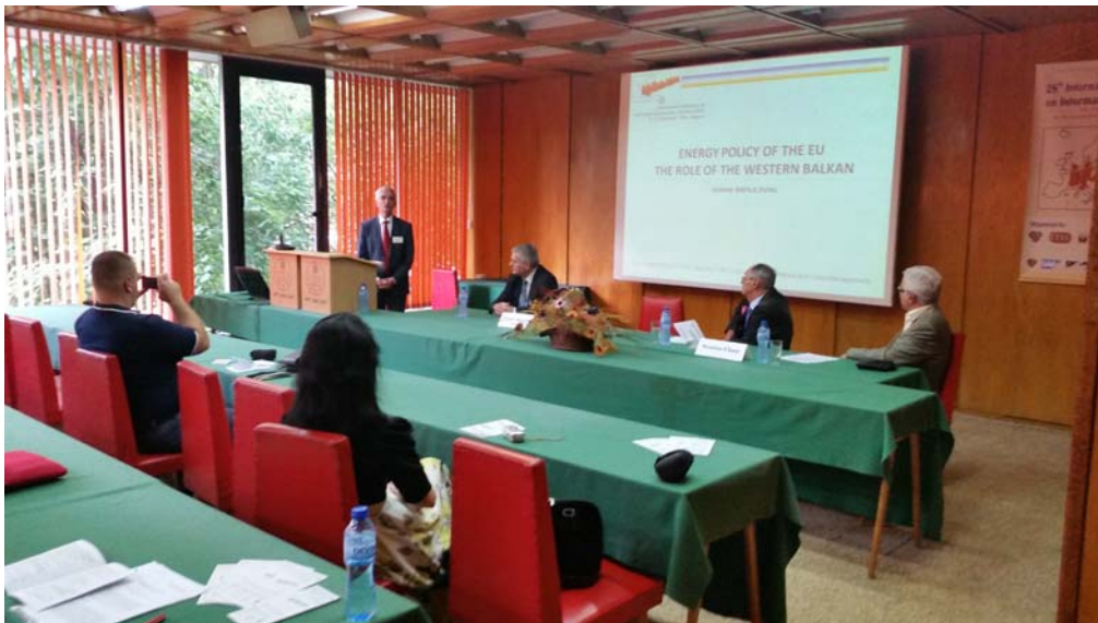
снимка 2. Пленарен доклад

Работните заседания бяха организирани в секциите: