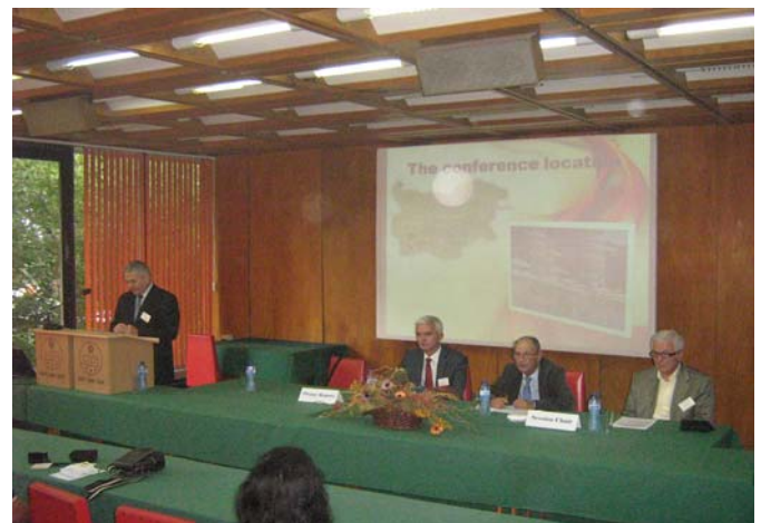
снимка 1. Официално откриване на InfoTech'14

В президума присъстваха дългогодишните членове на Организационния комитет проф. Васил Фурнаджиев (НБУ) и проф. Димитър Цанев (УАСГ), както и проф. Горан Рафайловски (Университета в Скопие, Македония), който изнесе пленарен доклад на тема Energy Policy of the EU – The Role of the Western Balkan ( снимка 2 ).