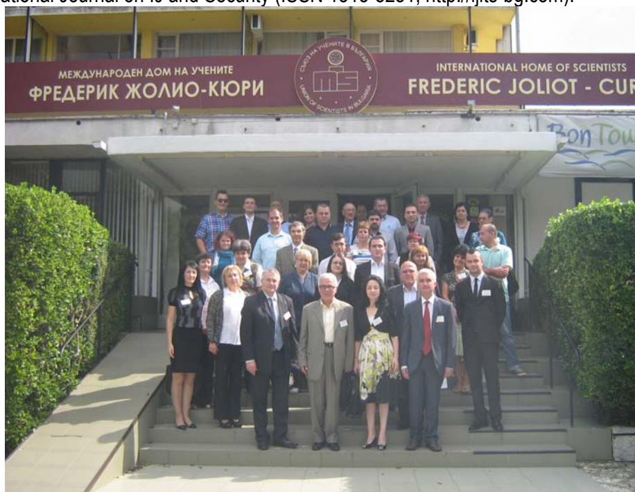
снимка 3. Основната част от участниците в ИнфоТех-2014